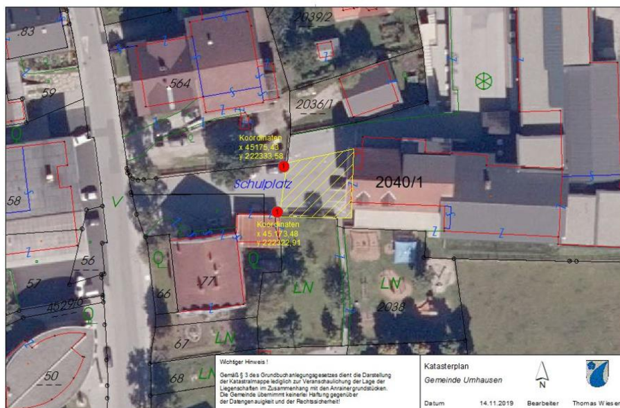
Planliche Darstellung 1

Diese Verordnung tritt mit der Aufstellung der Verkehrszeichen in Kraft.