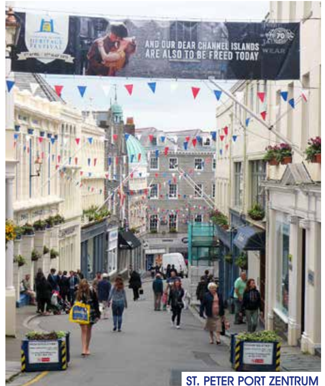
ST. PETER PORT ZENTRUM

Die Einheimischen sind alle sehr freundlich und pflegen die „englische Höflichkeit“. Viele arbeiten bei Banken, Versicherungen oder internationalen Firmen, da Guernsey oft als „Steuerparadies“ bezeichnet wird. Es ist kaum zu glauben, dass ich vor einem Jahr noch gar nicht wusste wo Guernsey genau liegt. Dank einer Empfehlung einer Freundin und einer Agentur bin ich hier her gekommen und hatte bis jetzt eine wunderschöne und aufregende Zeit. Ich liebe den französischen Flair und die Vielfalt der Insel. Ich kann ehrlich sagen, dass ich gerne hier bin und mich auf den Sommer sehr freue. Viele Veranstaltungen stehen bevor, wie zum Beispiel „Seafront Sunday“. Das ist ein wunderschönes Fest am Hafen, das an sieben Sonntagen im Sommer ausgetragen wird. Die Themen sind immer verschieden, einmal dreht sich alles um das Thema Essen, ein anderes Mal geht es um Kunst. Das Leben hier ist ganz anders als daheim, viel gelassener und weniger Stress. Der Sommer ist wunderschön und ich würde die Channel Islands auf jeden Fall als Urlaubsziel empfehlen.