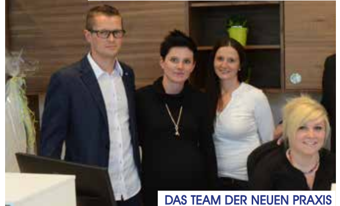
DAS TEAM DER NEUEN PRAXIS