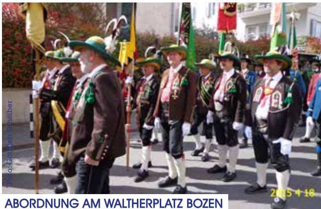
ABORDNUNG AM WALTHERPLATZ BOZEN

Für die Altschützen der Schützenkompanie Umhausen fanden im Frühjahr folgende berichtenswerte Ereignisse bzw. Ausrückungen statt: