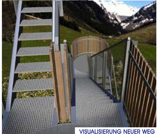
VISUALISIERUNG NEUER WEG