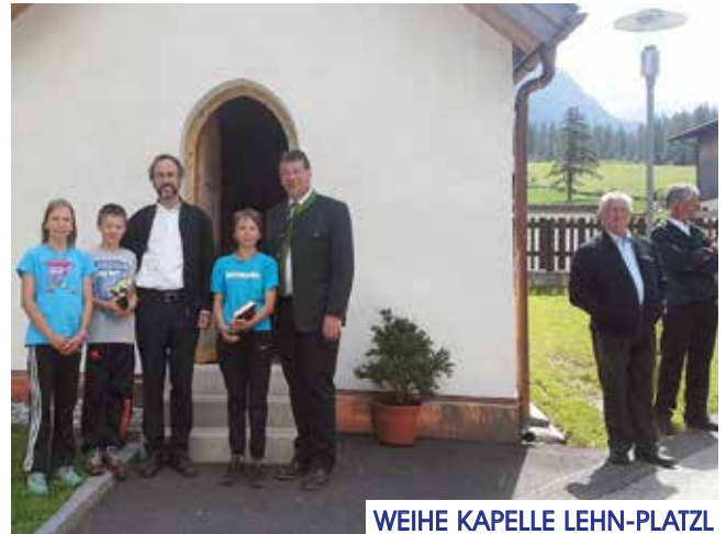
WEIHE KAPELLE LEHN-PLATZL

Neueinglasung der Bilder und Kreuzwegstationen