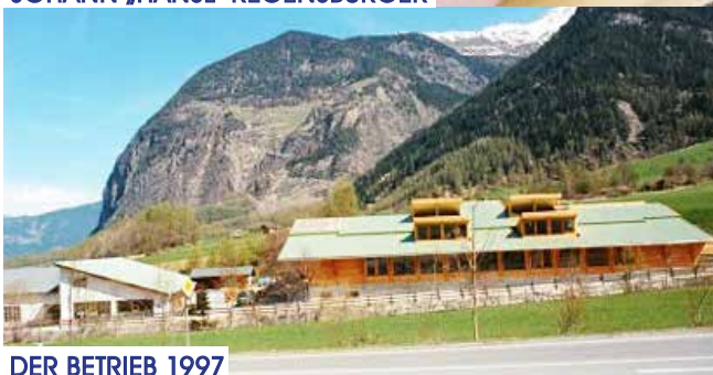
DER BETRIEB 1997