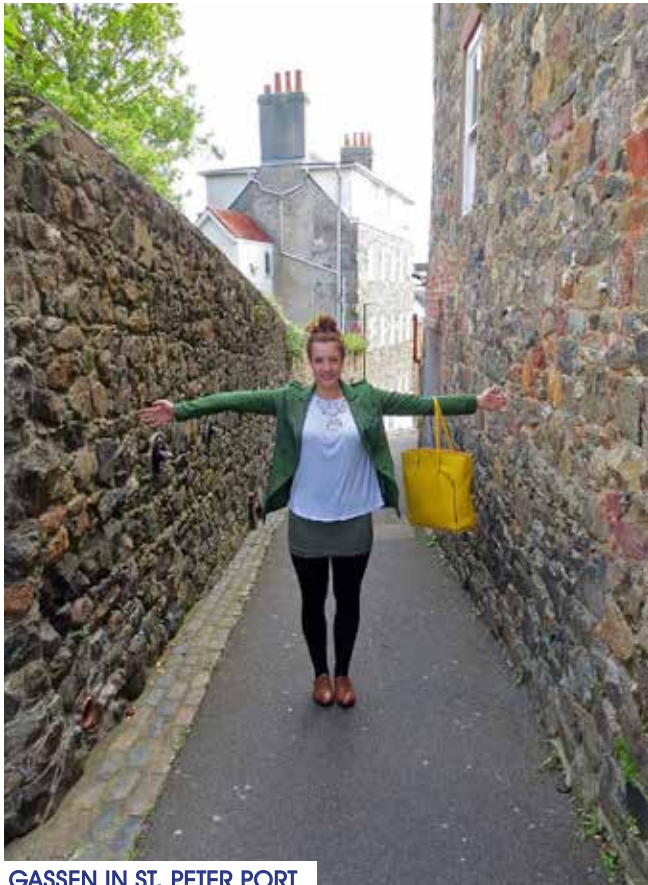
GASSEN IN ST. PETER PORT