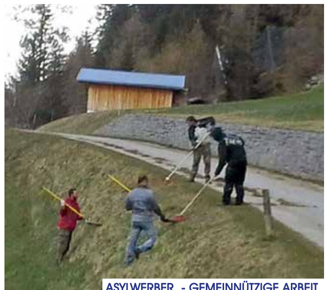
ASYLWERBER - GEMEINNÜTZIGE ARBEIT