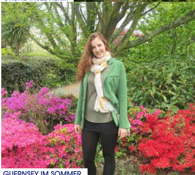
GUERNSEY IM SOMMER