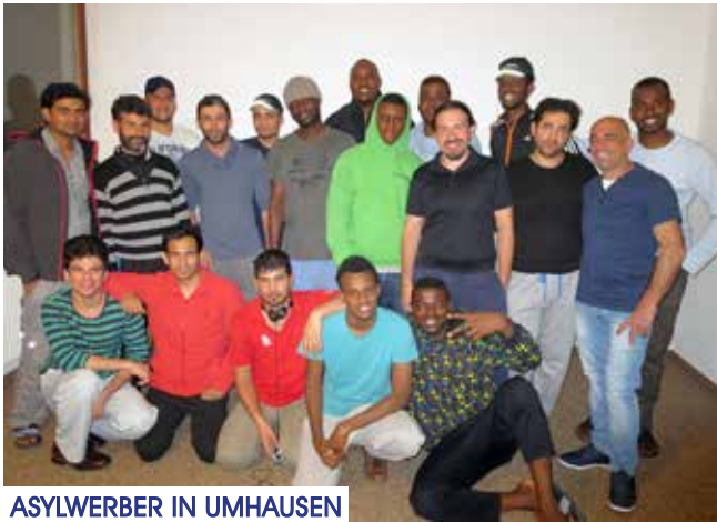
ASYLWERBER IN UMHAUSEN

Seit dem 11. Februar 2015 sind in unserer Gemeinde Flüchtlinge untergebracht. Da sie sich nun alle etwas bei uns eingelebt haben, ist es an der Zeit, etwas mehr über unsere neuen Mitbürger zu erfahren. Es sind 20 Männer zwischen 18 und 45 Jahren und sie kommen aus neun Nationen mit drei verschiedenen Religionen. Manche von ihnen sind Familienväter. Die meisten sprechen gut Englisch und alle sind mittlerweile eifrig beim Deutsch lernen!