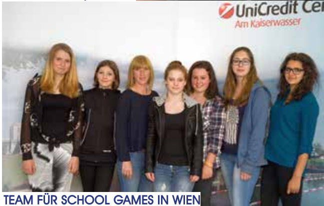
TEAM FÜR SCHOOL GAMES IN WIEN