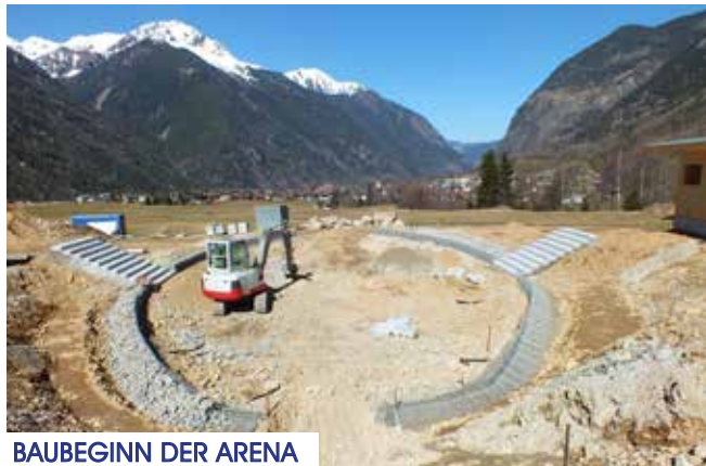
BAUBEGINN DER ARENA