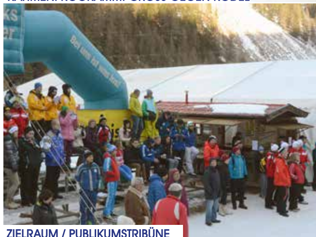
ZIELRAUM / PUBLIKUMSTRIBÜNE