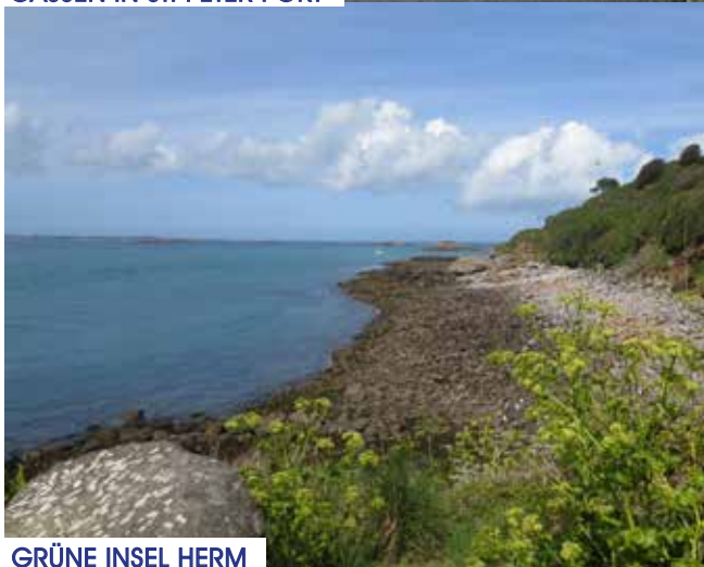
GRÜNE INSEL HERM