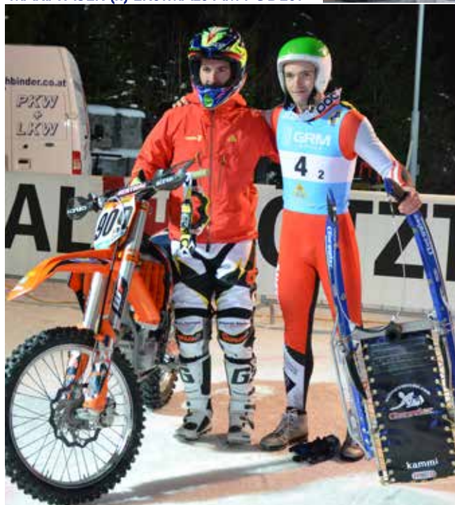
RAHMENPROGRAMM: CROSS GEGEN RODEL