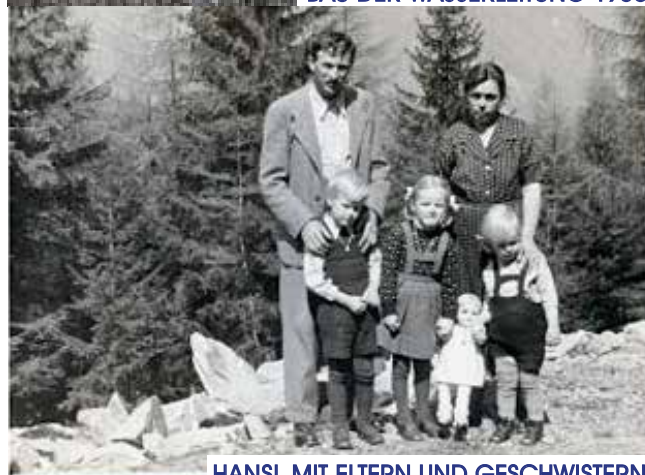
HANSL MIT ELTERN UND GESCHWISTERN