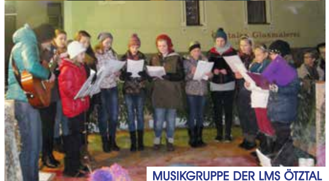
MUSIKGRUPPE DER LMS ÖTZTAL

Ein Miteinander, das wir auch weiterhin pflegen möchten.