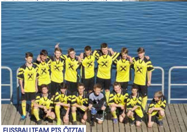
FUSSBALLTEAM PTS ÖTZTAL