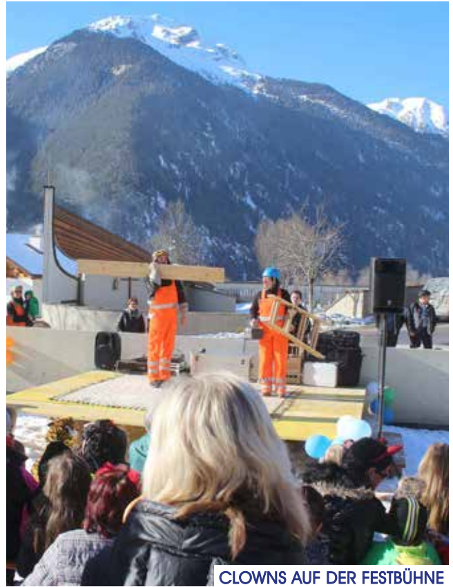
CLOWNS AUF DER FESTBÜHNE