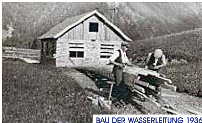
BAU DER WASSERLEITUNG 1936